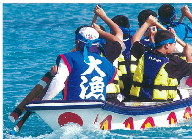
船の最後尾で舵をとるのは、伊江島の海人の役目。

レース終了後タイムを聞いて盛り上がるひととき。ベストを尽くした事は筋肉痛がなによりの証拠。腕と腰のあたりがばんばんです。