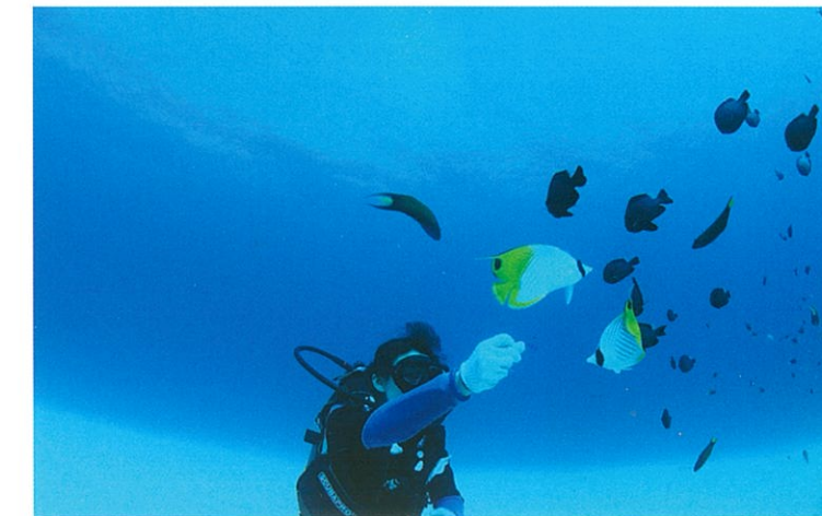
人懐っこい熱帯魚たちとの触れ合い。まさに楽園にいる気分。

ビーチスノーケルで無理なく海に入るのもおすすめ。浅瀬でも感動的な透明度を存分に味わうことができる。