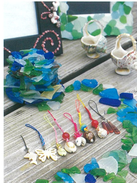
砂浜に流れ着いた漂着物から生まれた作品の数々。右は、自作の貝殻ストラップ片手にご機嫌な女の子。

毎日毎日コンディションが異なる海。天候を読んで危険を避けるのも海人に培われた“勘”だ。そんな時がっかりせずクラフト体験を楽しんでほしい。海辺の貝殻や不思議な形をした石、波と砂に洗われた滑らかなガラス、気に入った素材を組み合わせてあなただけのアートを表現してみよう。