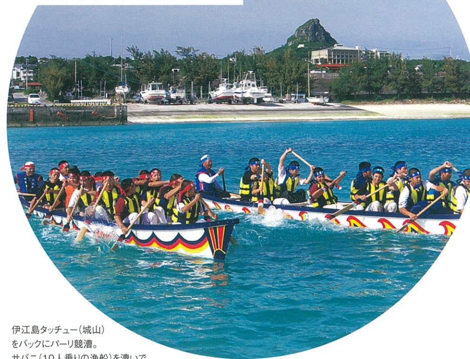
伊江島タッチュー(城山)をバックにバーリ競漕。サバニ(10人乗りの漁船)を漕いでタイムを競う。海人遊学一押しイベントだ。

ただでさえ美しい伊江島のビーチや海だけど、伊江島の海人たちは、自分たちが長年漁業で培った知識や技、そして海での勘を安全に楽しく伝えることが出来たなら、きっと特別な体験になるに違いない、そうわくわくしながら考えたんだ。これまでとは違った海の面白さや豊かさ、伊江島の海のユニークな魅力を知りつくしている海人ならではの表情や身のこなし。大自然のパノラマに抱かれながら、本物の海人と触れ合う時間は子供だけでなく大人にとっても最高のアクティビティ。かけがえのない思い出になるのはもちろん、この島にもひとつの世界があることに気づく、本物の体験学習。「海人遊学」の名に込めた海人たちのまっすぐな想いを受け取ってほしい。