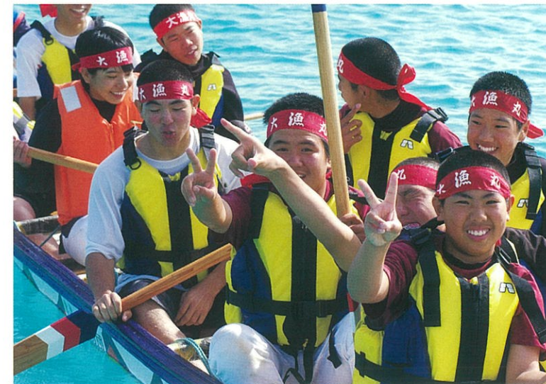
バーリ競争は男子だけのものではありません。女子(写真左、オレンジのライフジャケット)だって負けてはいません。突き通った海面を揺ぎ分ける感覚にテンションも最高潮!

航海安全や豊漁を祈願して行われる海人によるサバニレース。ここ伊江島では、“バーリ”と呼ばれ、古くから大切に受け継がれてきた伝統行事だ。リーダーの「せいっ!」の掛け声に対し、みんなで「オーイ!!!」と気合いを呼応させ、突き進む様は壮観の一言。「海人遊学」のメインイベントとも言える“バーリ体験”は外せない!