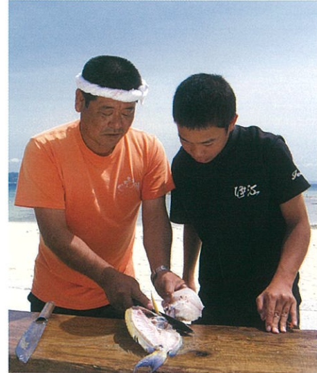
屋外の特設キッチンでいざ調理。空腹を我慢しながらも真剣な眼差しで魚をさばく。このプロセスがあるからこそこの海人カレー。

※海人カレー体験には、調理体験が含まれています。※他の海人遊学プログラムとセットの場合、昼食のみのご提供も可能です。