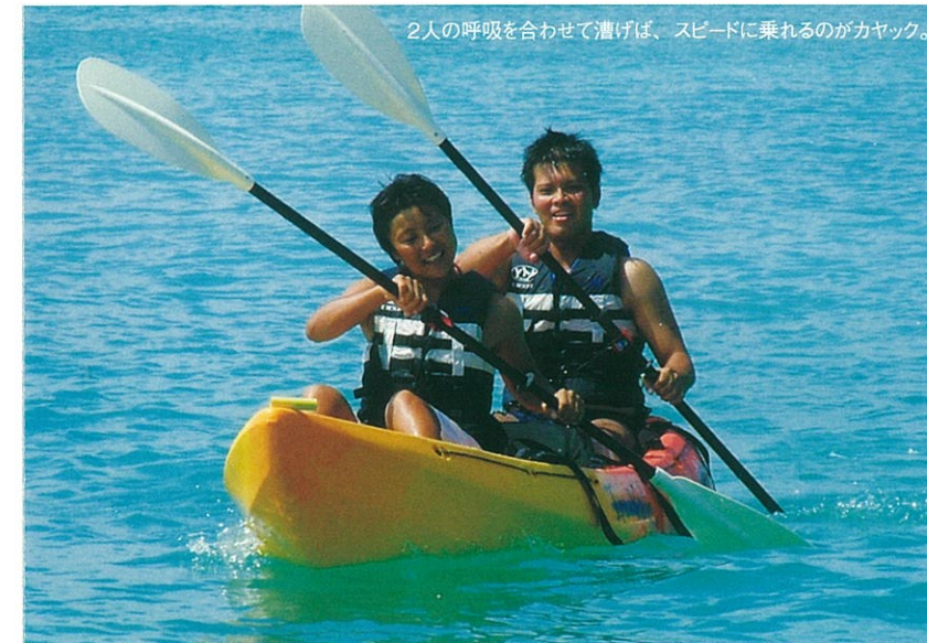
2人の呼吸を合わせて漕げば、スピードに乗るのがカヤック。

体験ダイビングはマンツーマンで行われるので初心者でも安心だ。ここから海の世界に本格的に魅了される人も多い。他にもシーカヤックやドラゴンボートなどのメニューは人気が高い。友達同士や家族で海上からの景色に癒されてみては。