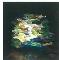
海辺で丸くなったガラスからこんなに幻想的なランプシェードが出来上がる。